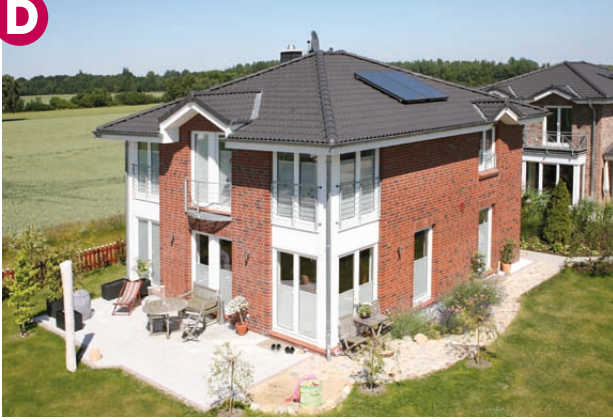
Scharlberg 39a, 1. Variante

Traumhaft – exklusive Stadtvilla direkt am Naturschutzgebiet. Hochwertige Materialien und Ausstattung, 4 Zimmer plus Vollkeller und natürlich ein moderner Grundriss; keine Schrägen im Obergeschoss. Der Baubeginn erfolgt im 1. Quartal 2010.