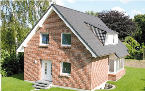
Scharlberg 39a, 2. Variante

Fläche: ca. 117 m 2 | Grundstücksfl.: 610 m 2 | € 331.000,-